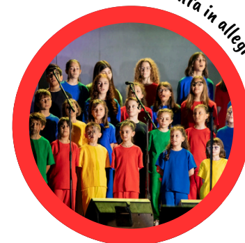
...un'esperienza che coinvolge